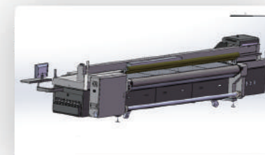
纠偏系统与张力调节装置